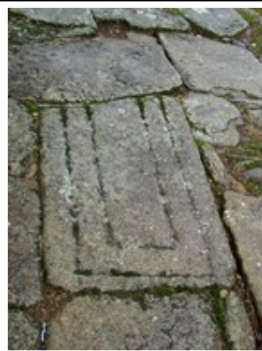
Lauda dunha tumba medieval no adro parroquial de Muíño [XMLS]