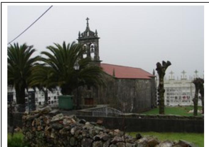
Igrexa de san Tirso de Muíño [XMLS]

No adro, unha das lousas próximas á entrada principal corresponde á lauda dunha tumba da época medieval.