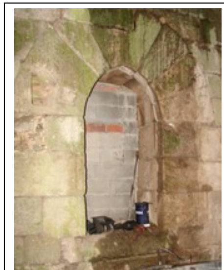
Arco do séc. XV ou XVI das Torres do Couto [XMLS]