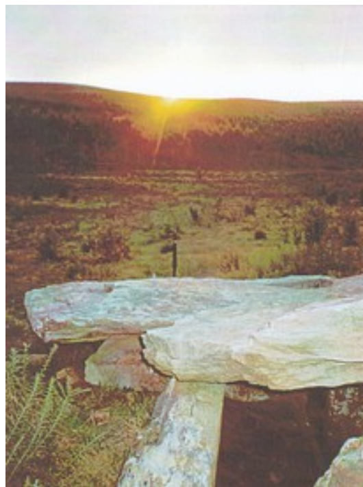
Amencer na Arca da Piosa o 21-12-2006 (a punta do paraugas orientada cara á saída do sol)