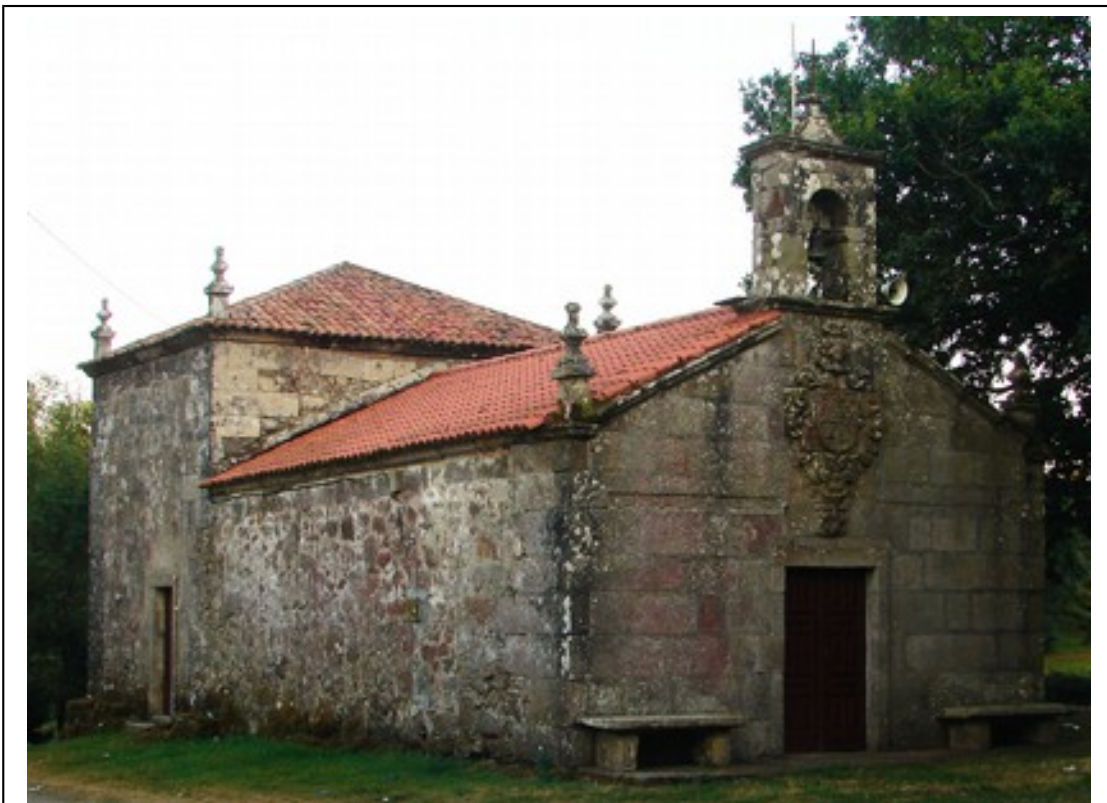
Ermida de santa Margarida de Muíño [XMLS]

Con todo, este santuario xa existía con anterioridade ao séc. XVIII: seica aquí xa había unha romaxe por 1670. Así e todo, o cardeal J. del Hoyo non fala del na súa visita á parroquia en 1607. Seguramente foi unha fundación privada dos señores das torres de Muíño, pois doutro xeito non se explicaría o fachendoso escudo de armas que estes fidalgos colocaron na propia fachada do edificio, sobre a porta principal (lado oeste). Coroado por un casco ou helmo con penacho, este escudo cuartelado deixa ver os símbolos dos Figueroa, dos Moscoso e dos Pazos e garda moita semellanza co do interior da igrexa parroquial de Muíño.