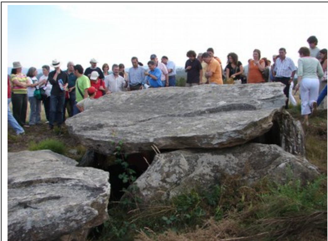
A multitudinaria visita á tumba do "valente Brandomil", no Simposio do Megalitismo da Costa da Morte 2006

(Eduardo Pondal.- Queixumes dos pinos; 1886).