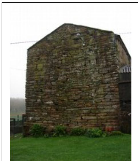
Parede sur dos restos da Torre do Couto