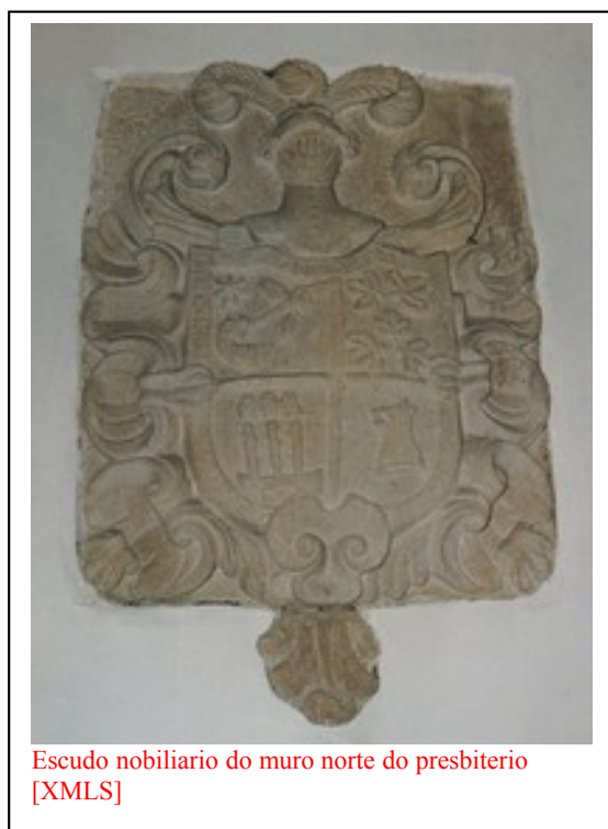
Escudo nobiliario do muro norte do presbiterio [XMLS]

Sobre un pé dereito a un dos lados do altar maior hai outra figura de pedra que representa o santo patrón da igrexa, san Tirso, de escasa calidade, pois apenas se aprecia algún trazo distintivo na anatomía ou nas roupas; leva nas mans unha serra, o seu atributo persoal, como recordo do último dos seus suplicios.