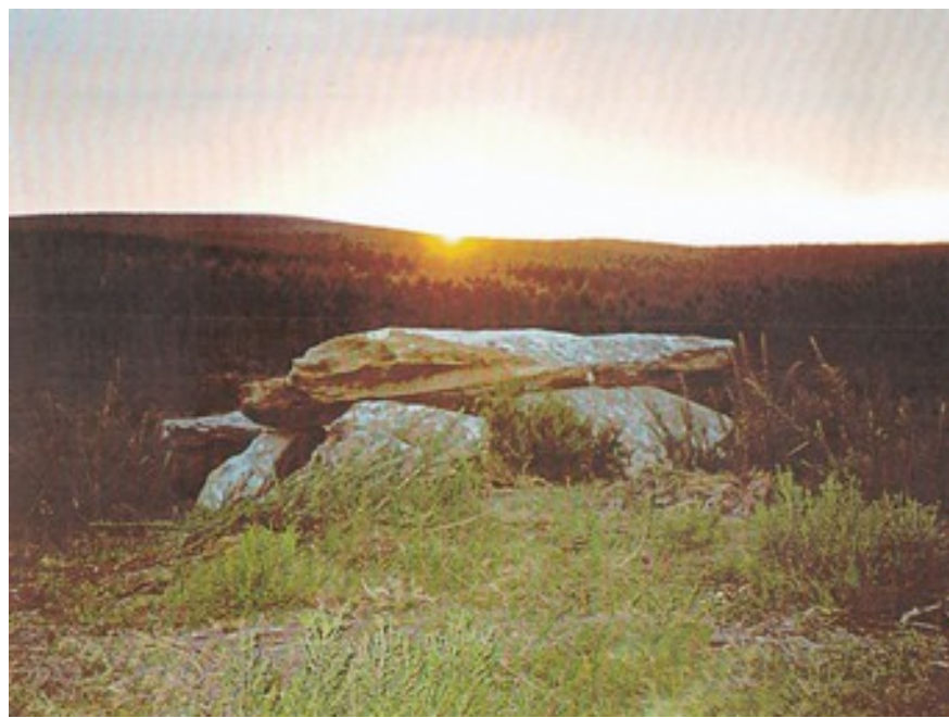
Entrada do sol na cámara da Arca da Piosa ó amencer do día 21-12-2006