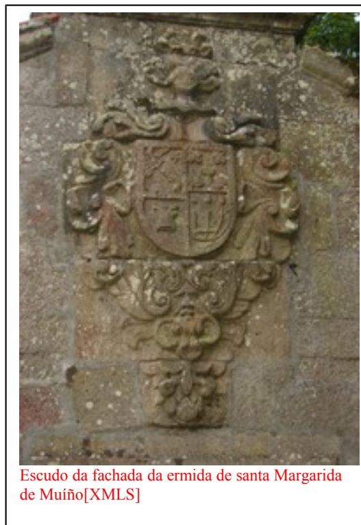
Escudo da fachada da ermida de santa Margarida de Muíño[XMLS]